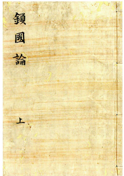
図一 「鎖国論」上巻の外観（個人蔵）

以下、近世後期においてどのような「鎖国論」が受容されたのかを追跡するために、一つの事例研究として、質量ともに芳醇に残されている馬琴の書翰および日記の中から関連する発言を総ざらいし、分析していく。この仕事は、ただに「鎖国論」受容の一端を明らかにするのみならず、関連して、近世社会における写本（複製本）作成をめぐる様相についても浮かび上がらせるものになると考えている。