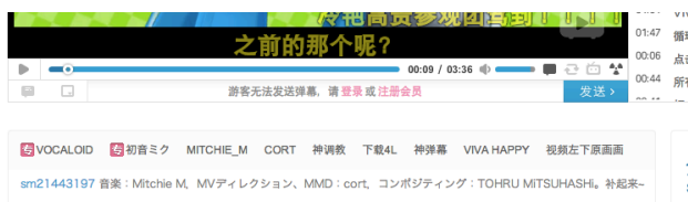
図 2 Bilibili でのタグ情報 (av689970)

図 2 に動画のタグの例を示す。タグは視聴者により動画へ付与されている。ニコニコ動画と同様に、bilibili でも最高 10 個のタグを動画に付与できる。図 2 の動画は、ニコニコ動画で「sm21443197」の識別子を持つ動画であるため、その情報がタグに記載されている。