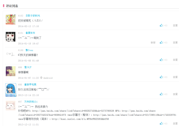
図 3 Bilibili での長コメント (av689970)

Bilibili には 2 種類の視聴者コメントが有る。一つは動画再生に合わせて画面上に流れるコメントである。これは「弹幕」と呼ばれている。弹幕コメントは匿名で、投稿者を特定できない。もう一つは会員名付きのコメントである。これを本稿では「長コメント」と呼ぶ。図 3 に示すように長コメントの例を示す。