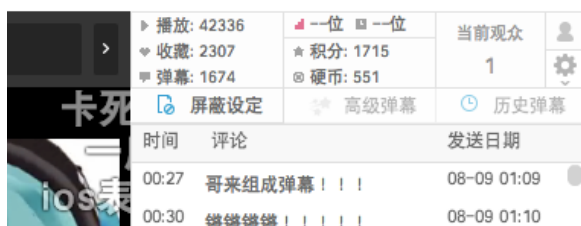
図 1 Bilibili での動画利用状況情報 (av689970)

図 1 に示すように 1 つの動画のメタデータには、題名、投稿者 (登録者名) の他に、動画再生回数 (播放)、コイン数 (硬币数量)、マイリストおよびブックマーク数 (收藏)、弹幕コメント数 (弹幕) の情報が有る。動画再生に合わせて画面上を流れるコメントを「弹幕」と名付けられている。