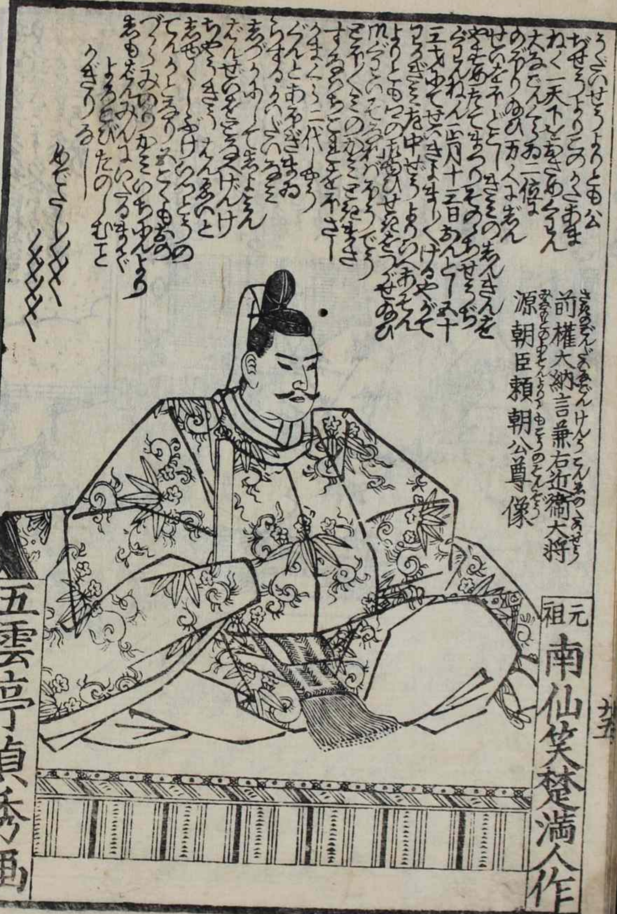
前権大納言兼右近衛大将 源朝臣頼朝公尊像