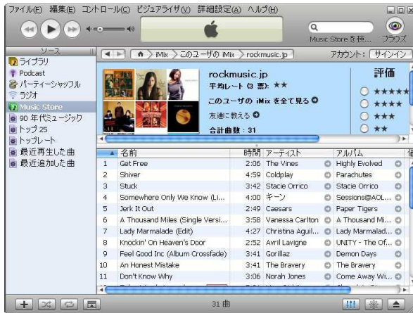
図 1 iTunes