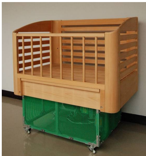
図1 実験2号機の外観