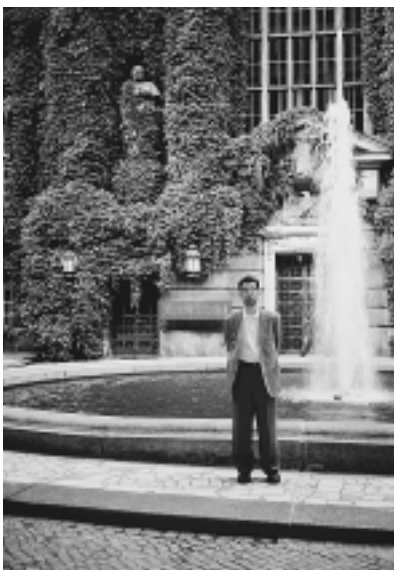
国立図書館前にて

これは、ウンター・デン・リンデンの、フンボルト大学に隣接する第1館とベルリン再開発の中心ともいべきポツダム広場に近い第2館との2つの建物からなり、開館時間は平日で9~21時、土曜日は第1館が9~17時、第2館は9~19時です。この図書館の起源は1661年で、蔵書数は書籍・雑誌で9百万冊(その他に手書き文書やフィルム類の所蔵が1千万点)だということです。ここへは、1マルクの1日券を購入すれば誰でも入館できますが(2つの館に共通)これだと開架の図書利用に限られます。書