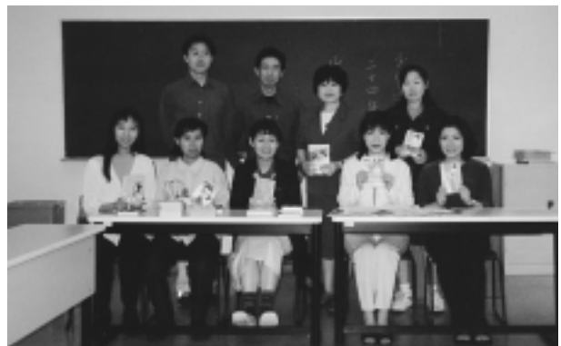
漫画学講座の学生たちと

「漫画学」はようやく始まったばかりである。これからは社会の容認を得る（まだ「漫画学」などいっても誰にも相手にされないだろう）ことが肝心であるが、それには成果をあげねばならない。毎年少しずつでも、本なり論文なりを出して成果を社会に還元してゆく（他の研究者が使えるような資料の