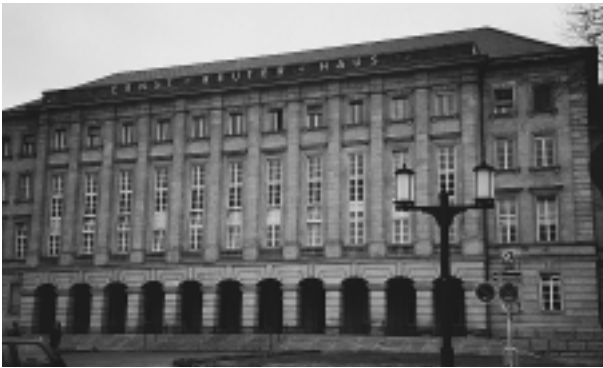
ベルリン市政府図書館の外観

申込用紙に記入しても可) 約20分後にはそれを受け取ることができます。その1部は館内で閲覧して必要部分をコピーし、また1部は借り出してマイクロフィルムに取ることができました。