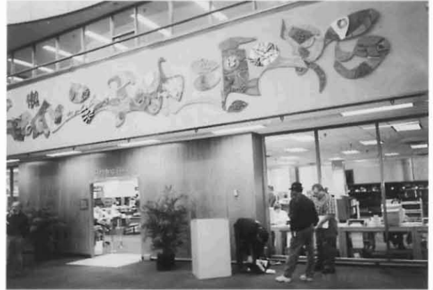
アメリカ国立医学図書館の閲覧室（Reading Room）入口