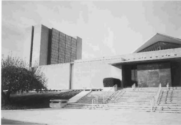
アメリカ国立医学図書館（右） 左手後方のビルは研究部門が入っているリスターヒルセンター