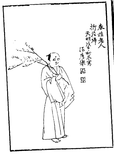
○廿七 天硯鳴玉集 7丁·8丁

歸處士父仲溫藉風流流於 詩賦其少壯日花月賞會山 川勝游提携騷士韻僧觸境 感情莫適而非詩料者也寂 屬意三春之候嘗有詩云人 情一月為花忙其杖屨探討 殆無虛日也可知已今也齡 頽知命謝絕交游以葆真於環