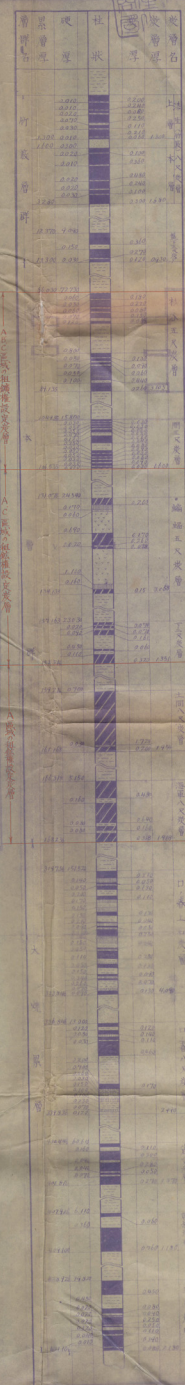
A-B 断面圖 縮尺五千分一