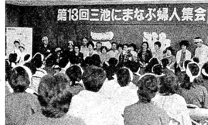
第13回三池にまなぶ婦人集會

やっこのごときで終戦になると、両親はささく家を買って私達のために平和な家庭を作りました。主人も間もなく定年を迎えようとしています。いずれ社宅を出て行かねばなりません、主人と一緒に、平和に暮らしていける世の中を築きたいと思っています。