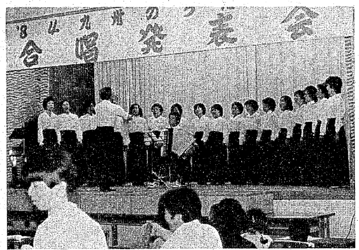
結成されてわずか半年。堂々と入賞を果たした『つわの花見事三位』。みんなであたしと、練習への参加を呼びかけている。

「八四年、九州のうたごえ合唱発表会」が大牟田市労働福祉会館で、九月三十日午後一時から開かれ、沖繩を除く各県から、うたごえ運動をすすめている中心合唱団(八団体)、職場・地域の合唱団(九団体)が参加しました。この発表会に三池主婦会の「つわの花見事三位」も参加し、「初恋」を歌い、大賞を受賞しました。二月に結成したばかりの「つわの花見事三位」も参加し、「初恋」を歌い、大賞を受賞しました。二月に結成したばかりの「つわの花見事三位」も参加し、「初恋」を歌い、大賞を受賞しました。