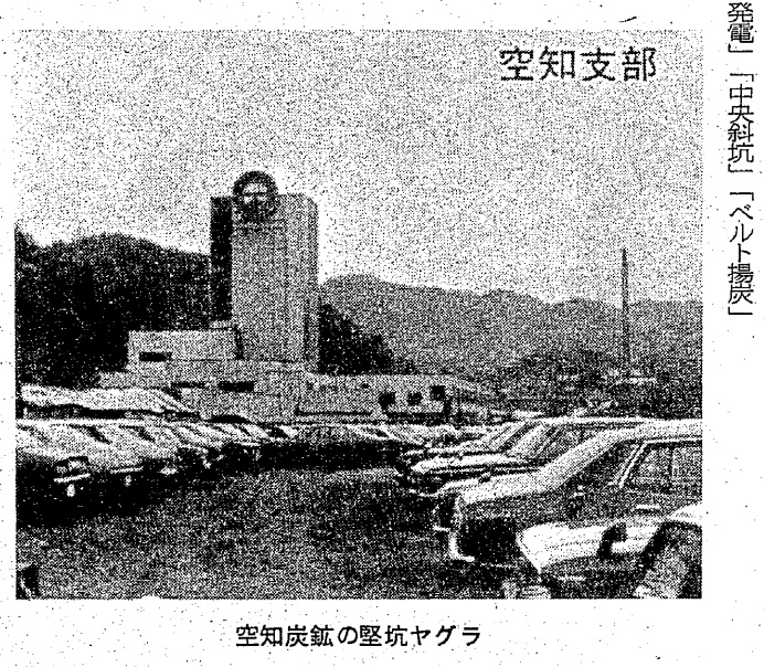
空知炭鉱の堅坑ヤグラ

「監獄の話はしましよか。そりゃあ人間の行へんじやなか、予言われどりました。看守は、あそこは地獄を言ったアス。そこは監獄。最初は集治監と言ったアス。そのあとに監獄となつて、そして大正十二年に、三池刑務所と言つたアス。」