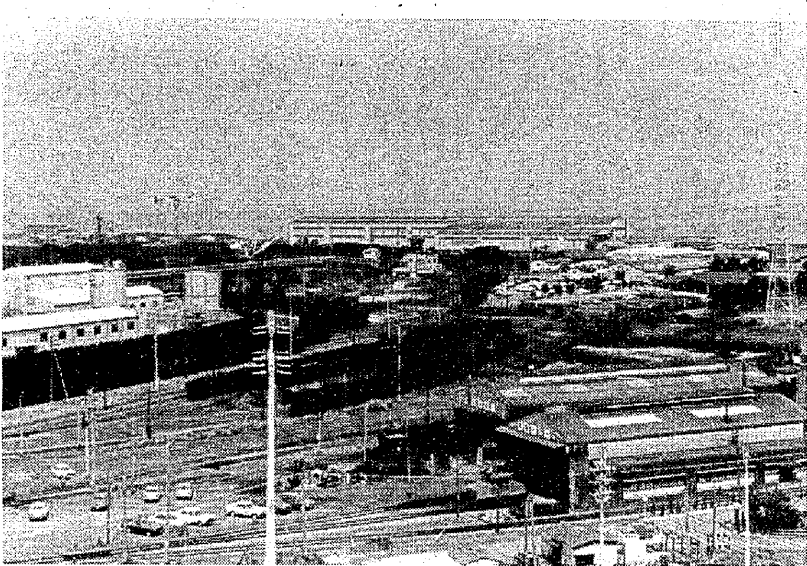
港務所構内の一部(右下の建物は電庫車)

六月十八日、三池炭鉱業所は給与員のうち、当面は希望者、振り込みによる利点として、希望する銀行で受け取る。(回線、盗難の心配がない。)必要な時に現金支給は七月十三日。