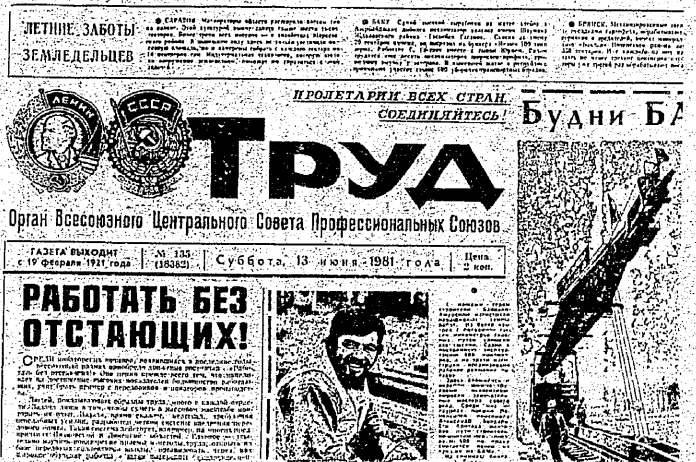
三川鉱落盤災害の記事が掲載されたソ連労働組合機関紙「トルド」。