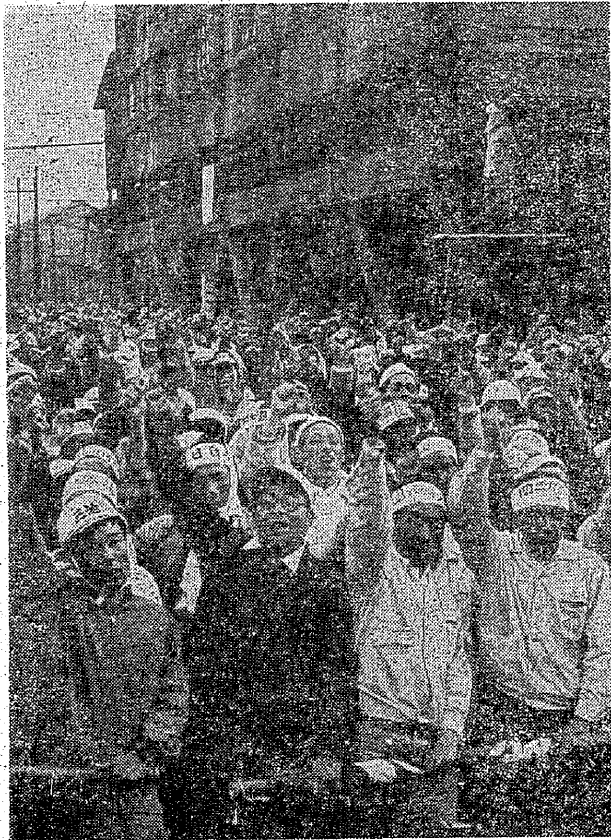
三池闘争の炎のなかで……

三池闘争に関する映画といえは現在まで五本あるが、それらのフィルムからエキストラなる部分をとり、それに現実の三池の闘い、全国労働者の闘い姿を加え、まったく新しい映画をつく