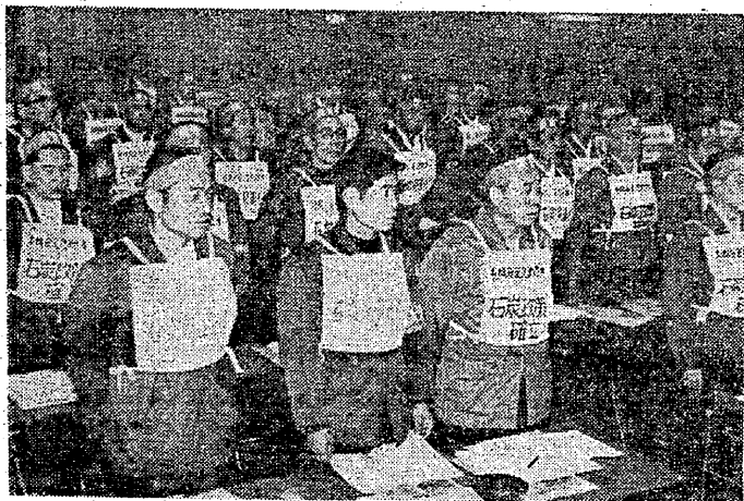
炭労中央行動団がなげ

「はじめ政府側も会社側も、この訴えをニヤニヤ笑っていた。同時に解決した」など、口をそろえてくり返すだけであった。