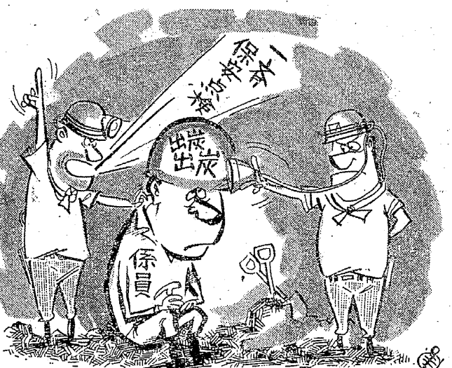
頭の中にあるのはこれだけ……

「わが身はわがで……」 「スミのことしか頭にない係員には、われわれの命をまかせるわけにはいかない。ケガした後に「しまった」と思ってもおそいし会社は本人の不注意としかかわない。自分の身は自分たちの力で守るしか方法がない。」