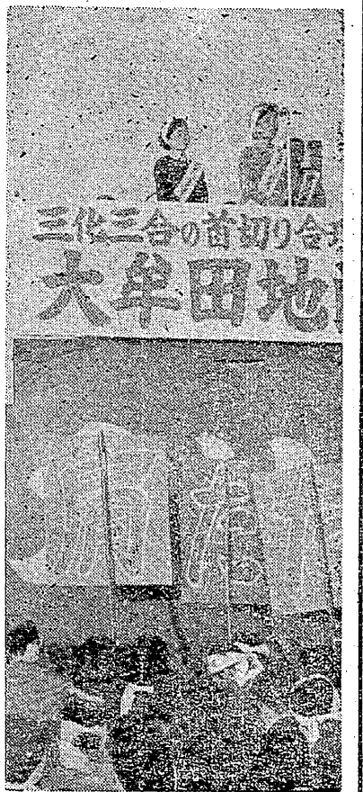
三化合の首切り集会 大牟田地区

んからそれぞれ経過報告のあと、三化、三合の仲間の首切り合理化攻撃を全労働者の共闘で粉碎しよう。 一、CO特別立法の制定を推進し患者と家族をみんなで守ろう。 一、大幅賃上げ獲得、物価値上げ反対、生活と権利を守ろう。 一、職場と地域に労働運動を強化し、不当解雇、組織分裂攻撃を粉碎しよう。 一、スローガンを採択、午後六時すぎから三井化学の正門で激しい抗議のデモを展開し、市内をデモ行進のあと解散した。 肩たたきにはげしい抗議 三化内部では雇用の悪質な肩たたきに対してはげしい抗議が職場で行なわれている。 先日はある課で、病欠中で健康の給付さえ切れているという組合員の家に課長、課長代理が他の組合員を使って肩たたきに行かせたことが明らかとなり、組合からはげしく抗議された。その結果、課長、課長代理が果物カゴを持って