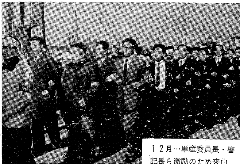
12月…単産委員長・書 記長ら激励のため来山