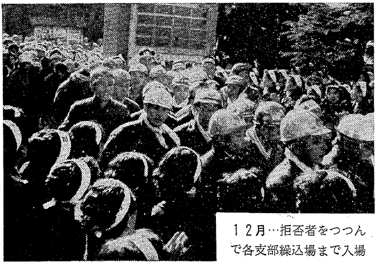
12月…拒否者をつつん で各支部繰込場まで入場