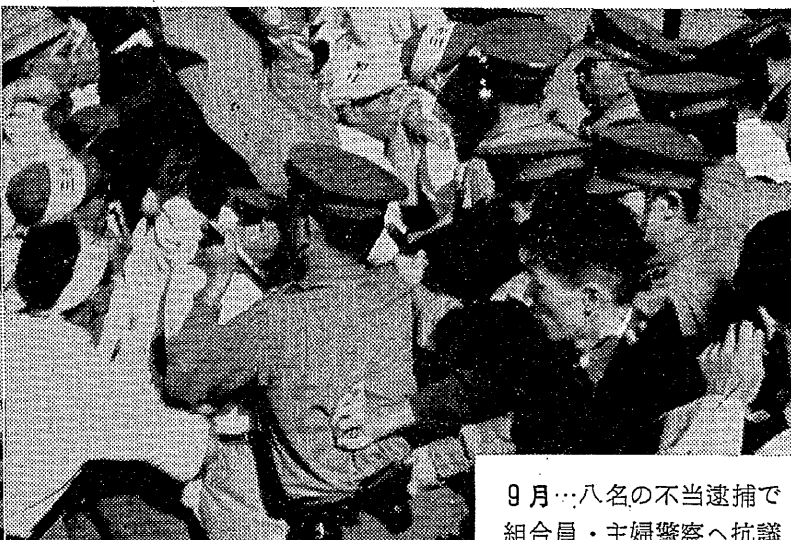
9月…八名の不当逮捕で 組合員・主婦警察へ抗議