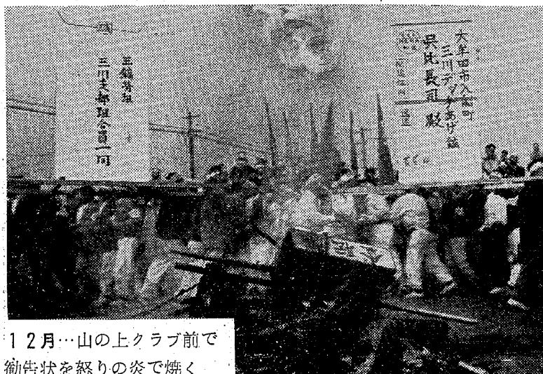
12月…山の上クラブ前で 勧告状を怒りの炎で焼く