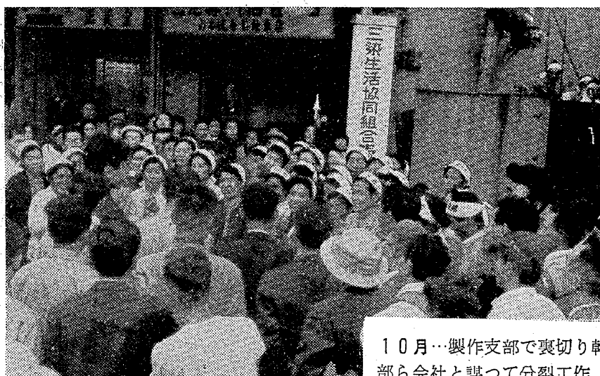
10月…製作支部で裏切り幹 部ら会社と謀って分裂工作