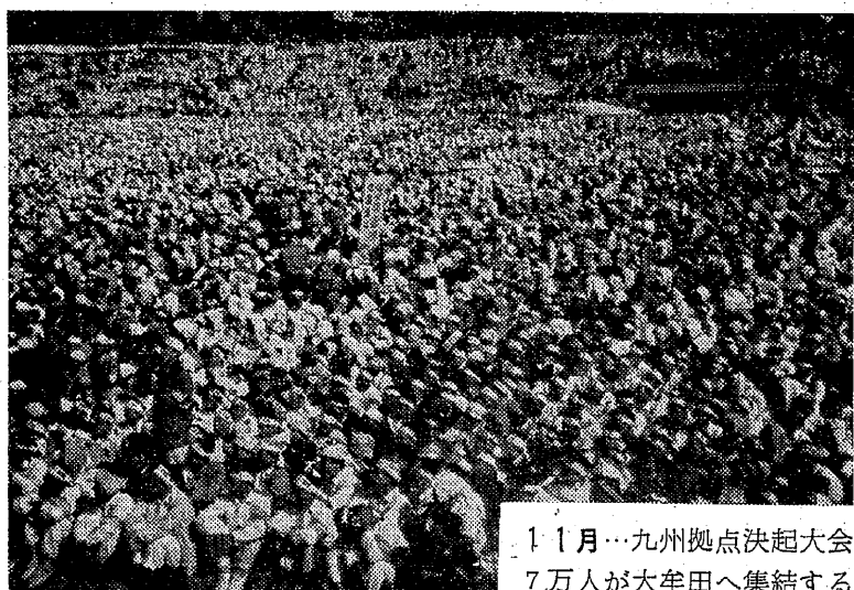
11月…九州拠点決起大会で 7万人が大牟田へ集結する