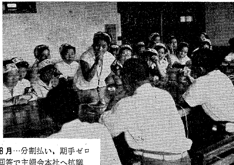
8月…分割払い、期手ゼロ 回答で主婦会本社へ抗議