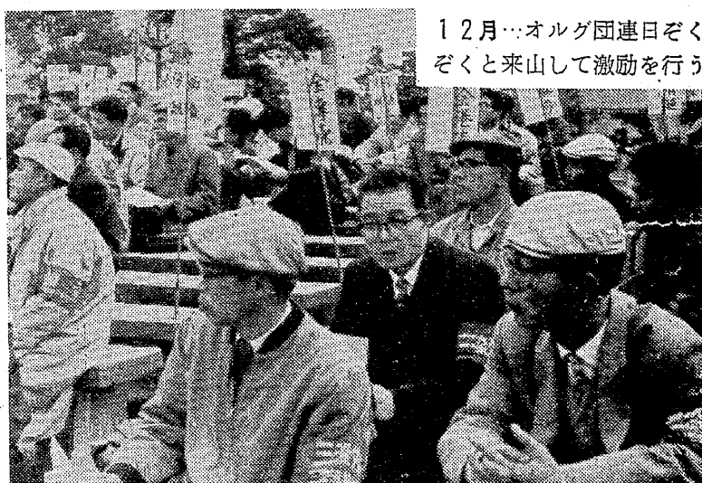
12月…オルグ団連日ぞく ぞくと来山して激励を行う