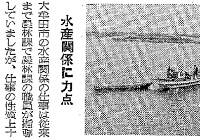
水産関係に力点を置くことになった

大牟田市の水産関係の仕事を従来よりも重視し、水産関係に力点を置くことになりました。水産関係に力点を置くことで、水産物の増産と漁民の生活安定を実現することを目指しています。