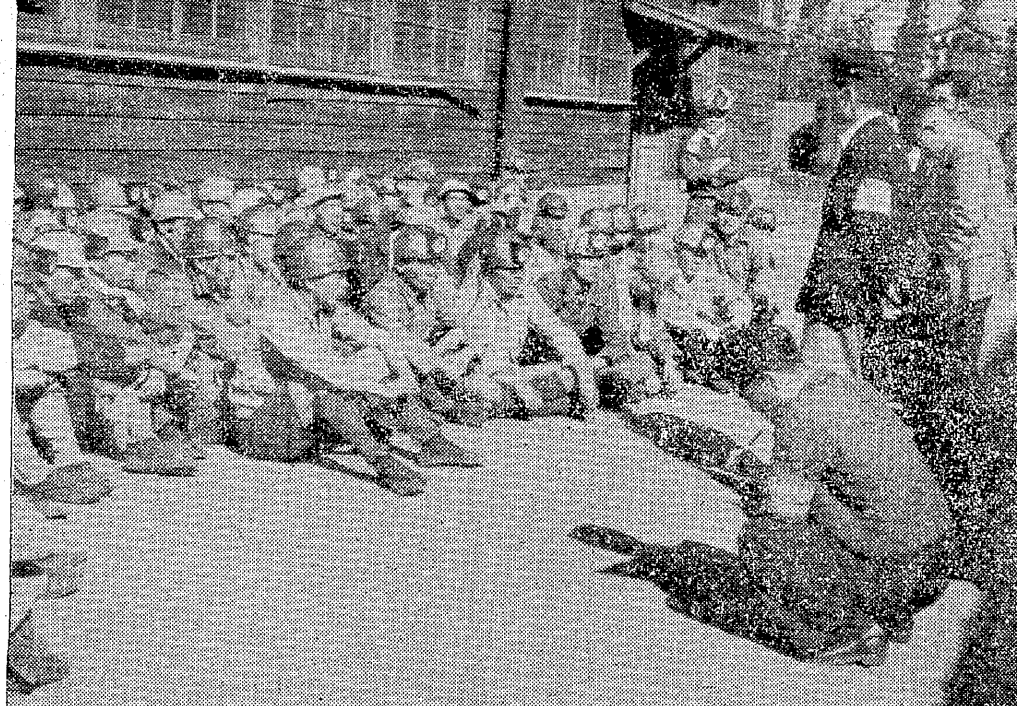
要求はみんなで闘いとる (職場闘争で坐込んだ三川町第一番方)

十月十三日、大牟田市の三池炭礦労働組合は、大牟田市の各会社連盟と交渉するに当たって、資金カンパや強力なデモで断固交渉権を勝ちとることを決意した。これは、大牟田市の各会社連盟が、労働組合の要求を拒否し、交渉を断絶したためである。労働組合は、この交渉権を勝ちとることで、労働者の生活向上と社会の安定に貢献する。この交渉権は、労働組合の権利であり、労働者の利益を守るために必要である。労働組合は、この交渉権を勝ちとることで、労働者の生活向上と社会の安定に貢献する。この交渉権は、労働組合の権利であり、労働者の利益を守るために必要である。