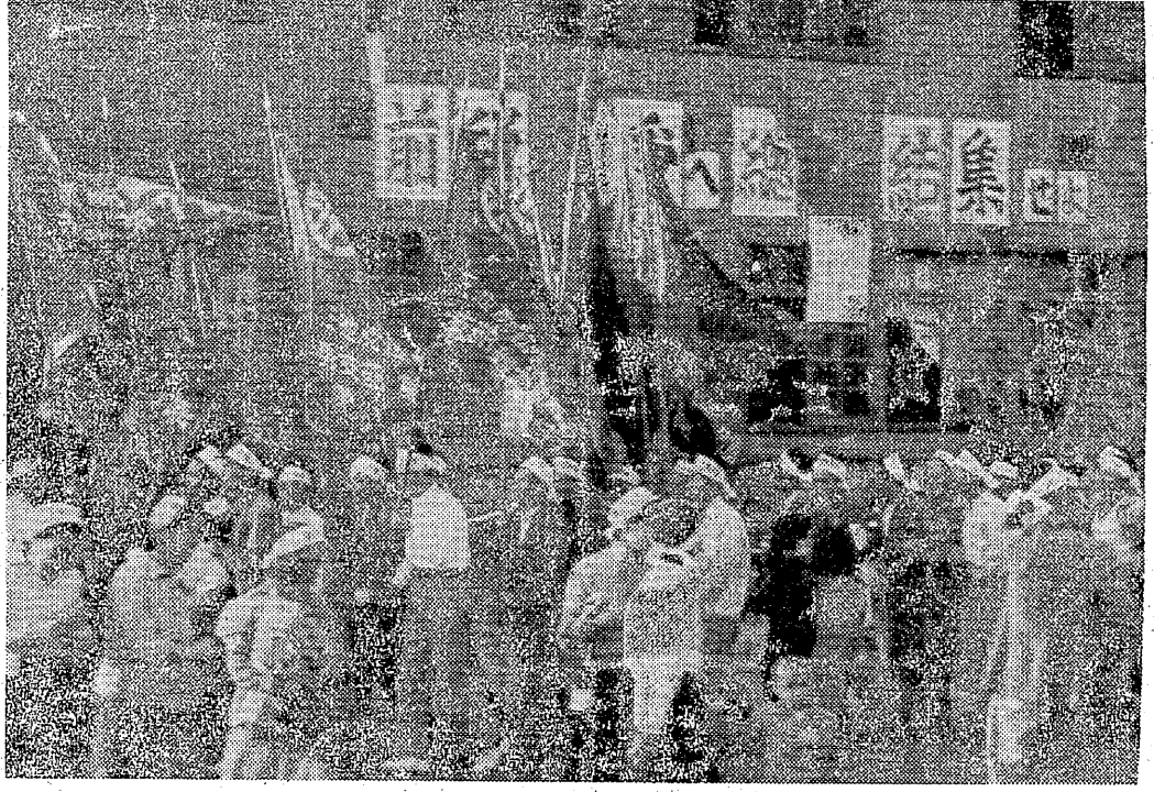
三港務所の前段斗争デモ

戦争態勢に在るアメリカから絶望されたデフレ政策は、愈々猛攻を奮って労働大衆の上から押しつけて来た。昭和三十年の春季闘争で、デフレ政策を撃破せんとする労働者階級の闘いの前哨戦が、本年の秋季闘争である。