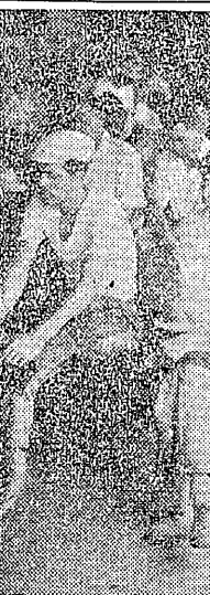
港務支部の現職部長 高田村の闘魂

港務支部の現職部長、高田村の闘魂。彼は、村民の利益を守り、合併問題に反対する立場を貫いている。 港務支部の現職部長、高田村の闘魂。彼は、村民の利益を守り、合併問題に反対する立場を貫いている。