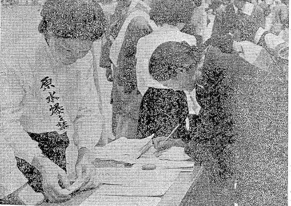
再び 島崎の悲慘を繰返すな (写真原画)

全組合員並びに家族に訴ふる。昨年の本日、わが三池連は三井炭山の無謀なる「首切り、企業合理化」と対決、全組合員並びに家族の怒りを結集し「総員配置」の一なる中間指令を決定した。