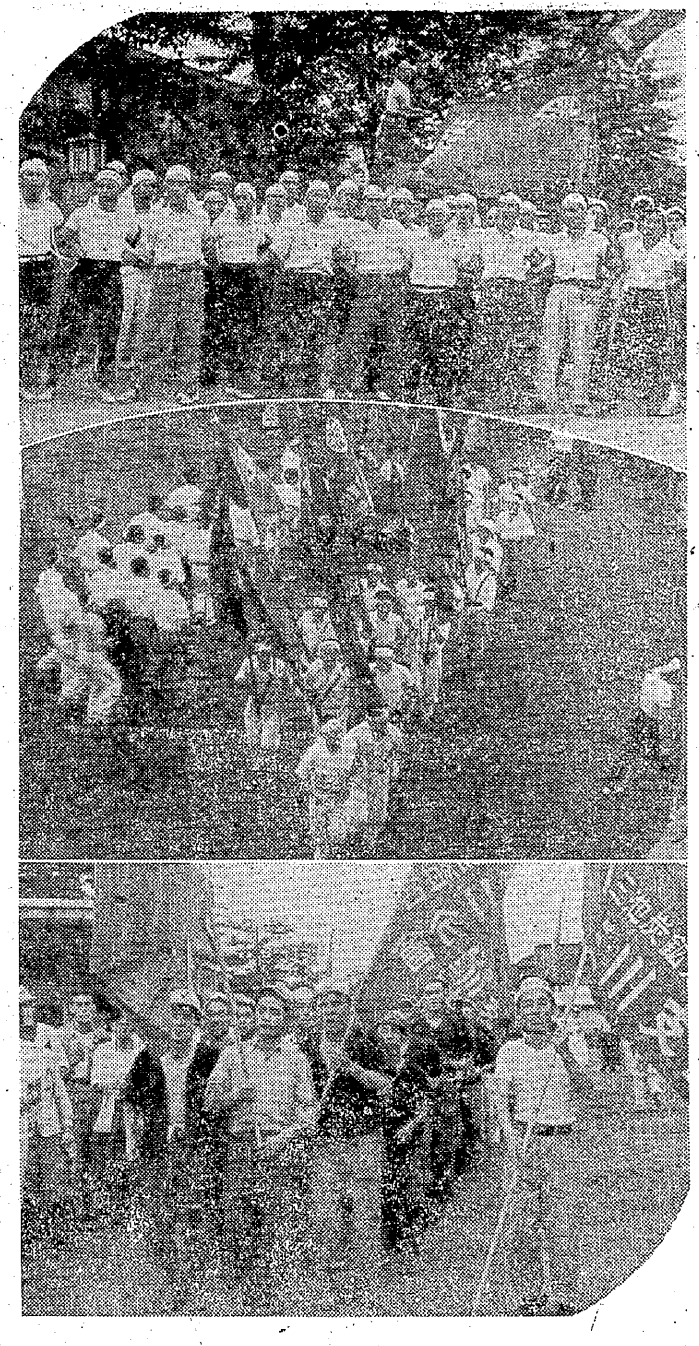
写真は何れも本社前のデモ

三池炭婦協会の結成一周年記念として、七月二十一日(日曜日)午後二時、本市三池町三池炭婦協会の会館で、結成一周年記念大会が開かれた。この日は、本市各地から約一万五千名の炭婦が参加し、大規模な集まりとなった。大会は、まず結成一周年の経緯を報告し、今後の活動方針が示された。その後、各地支部の報告が行われ、活発な討論が行われた。午後四時、会場を後にして、市街を練り歩いた。このデモは、炭婦の生活改善と労働条件の向上を訴えるもので、大規模な集まりとなった。デモは、市街を練り歩いた後、三池炭婦協会の会館で閉幕した。