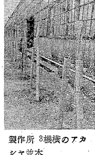
製作所 機械のアカ シャ並木

三池炭婦協会の結成一周年記念大会が、七月二十一日(日曜日)午後二時、本市三池町三池炭婦協会の会館で開かれた。この日は、本市各地から約一万五千名の炭婦が参加し、大規模な集まりとなった。大会は、まず結成一周年の経緯を報告し、今後の活動方針が示された。その後、各地支部の報告が行われ、活発な討論が行われた。午後四時、会場を後にして、市街を練り歩いた。このデモは、炭婦の生活改善と労働条件の向上を訴えるもので、大規模な集まりとなった。デモは、市街を練り歩いた後、三池炭婦協会の会館で閉幕した。