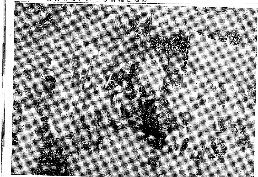
蓄切りは切られても地獄、残つても地獄 (9月5日製作所正門前にて)

本炭組の蓄切りは、九月五日製作所正門前にて、切られても地獄、残つても地獄の状況であった。この蓄切りは、三池炭組の経営方針に基づき、蓄積された在庫を処分するものである。この蓄切りは、三池炭組の経営方針に基づき、蓄積された在庫を処分するものである。