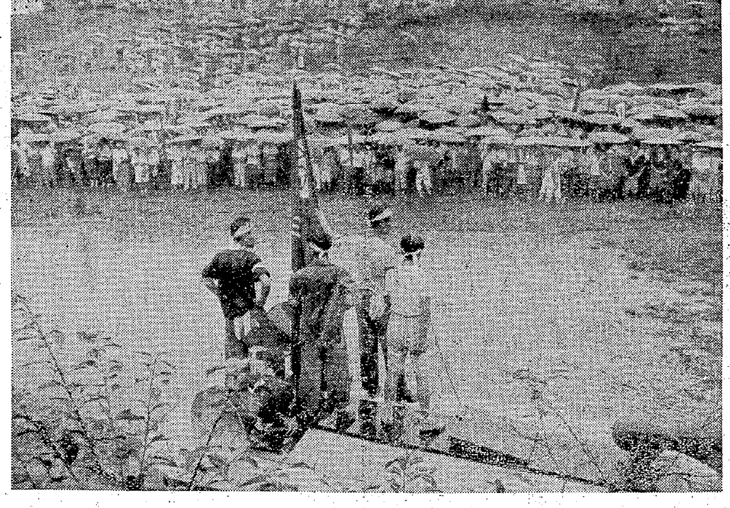
完全撤回の日まで我等闘う

企圖、十月以降賃金、統一労働協約の重要課題を柱として炭労臨時全大会（第八回）は九月一日から六日まで東京中野区中野公会堂で開かれ、企業側と労働側との間に、賃金、労働条件の決定を再確認して統一労働協約の性格を明確化した。企業側は、賃金、労働条件の決定を再確認して統一労働協約の性格を明確化した。企業側は、賃金、労働条件の決定を再確認して統一労働協約の性格を明確化した。