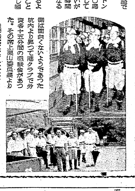
病の婦人も参加 本所支部炭婦協気昂し

病の婦人も参加 本所支部炭婦協気昂し。病の婦人も参加して、活動が活発化している。炭婦協会の活動が、病の婦人も参加して、活発化している。病の婦人も参加して、活動が活発化している。炭婦協会の活動が、病の婦人も参加して、活発化している。