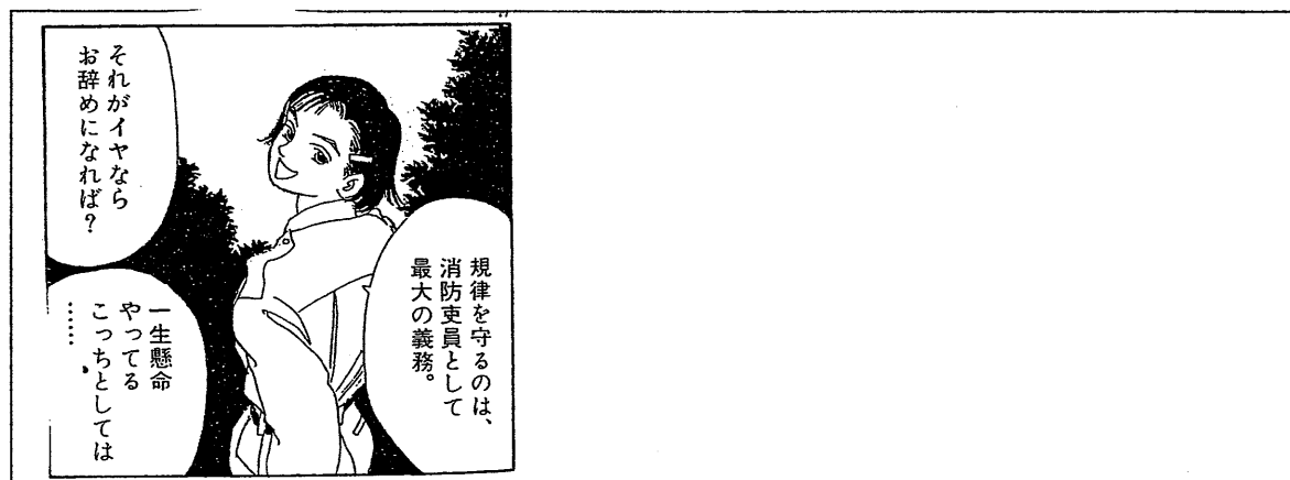
図4 火消し屋小町 夏子とこづえ

こづえはもともと女性語をかなり用いる話し手であるが、仕事を辞めるよう迫る極めて攻撃的な発話では、年齢もほぼ同じであらゆる意味で同等の同級生夏子に対し、尊敬形の述語という過剰に丁寧な、ジェンダーという観点から見れば非常に女性的な形式を採用している。