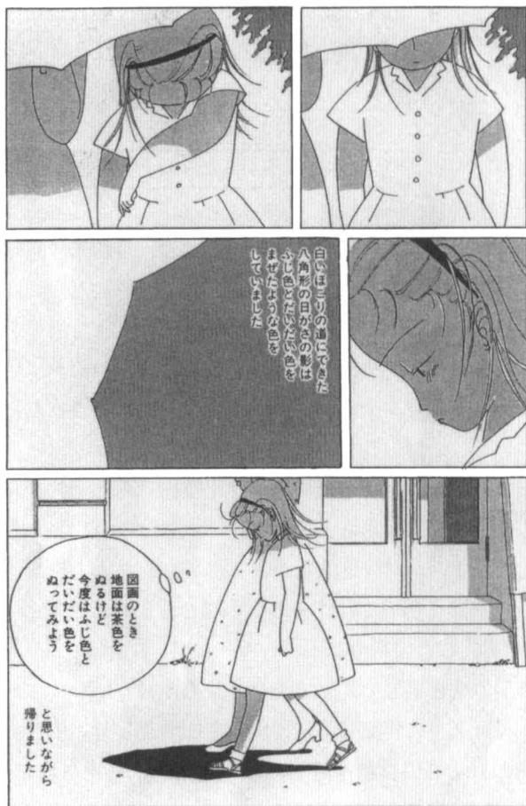
図3 高野文子「玄関」より

守られながら帰っていく時に感じた内面の表現は少女の心の変化を含ませていて象徴的である。控えめな吹き出し内外の内面表現の用法、絵自体は単純ながらも影をうまく用いた確かな描写が、一見地味ではあるが豊かな心理描写を行っている。