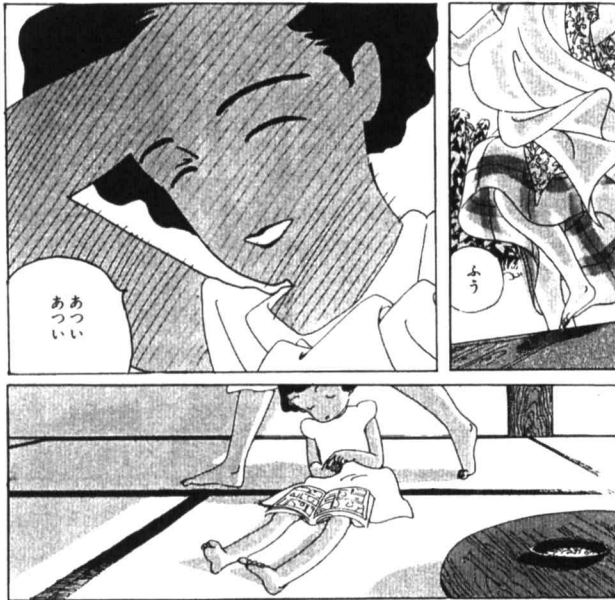
図1 高野文子「玄関」より