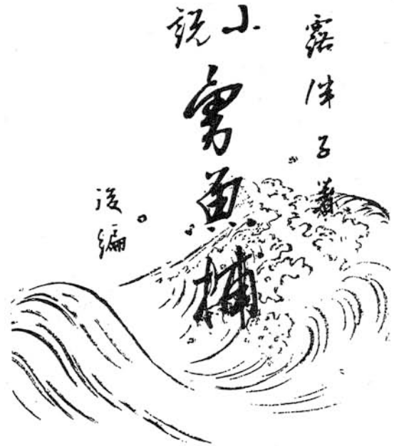
※ 幸田露伴『勇魚捕』前後編 下段…同加(袋)