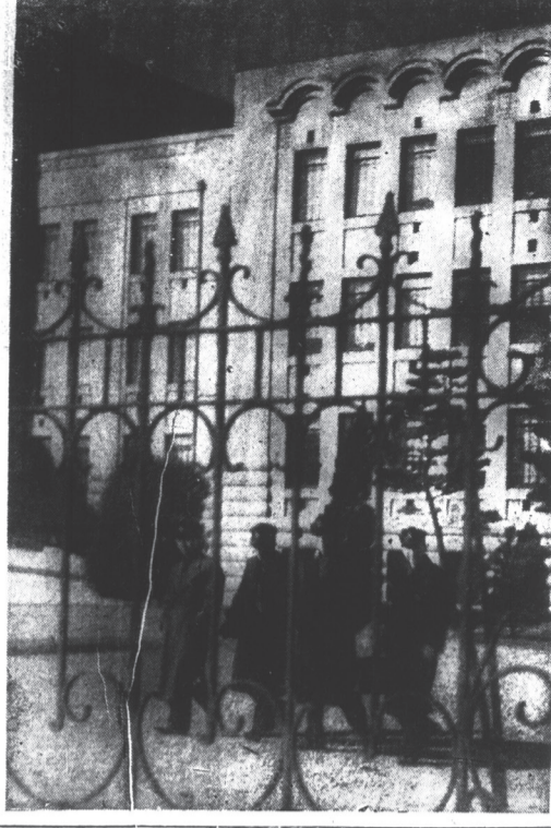
學園を去る人々 (正門前)

鐵道省は、本年三月に九州帝國大學の醫學部に、鐵道省委託生を募集する。募集の目的は、鐵道省の職員に必要とする醫學的知識を授け、その技術を發揮せしむることにある。募集の条件は、高等學校卒業以上、年齢十八歳以上、二十五歳以下、男子に限る。